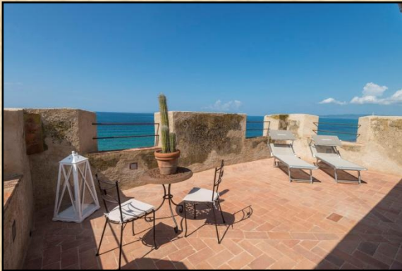
Suite „Santa Maria“ (30 qm) in der 3. Etage für 2 Personen; mit Jakuzzi und großer Terrasse