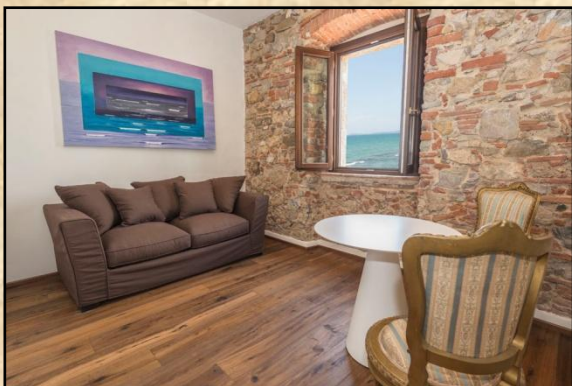
Suite „La Pinta“ (28 qm) in der 1. Etage für 2 Personen