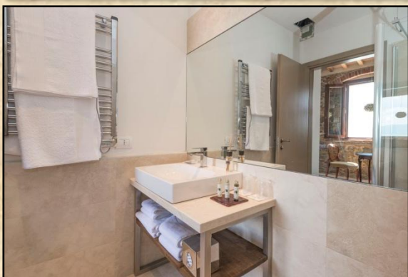
Suite „La Nina“ (18 qm) in der 2. Etage für 2 Personen