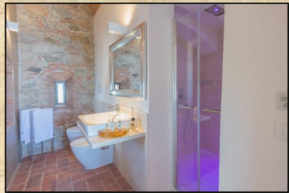
Suite „Indiscret“ (32 qm) in der 1. Etage für bis zu 4 Personen